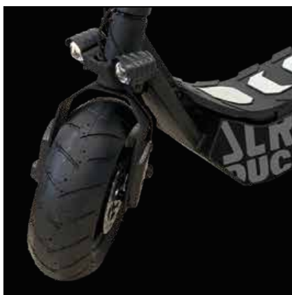
Dvojitá přední LED světla