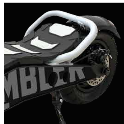
Bezdušová kola 110/50-6,5"