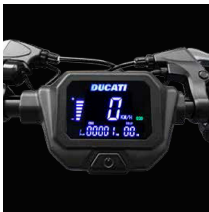
Velký 3,5" LCD displej